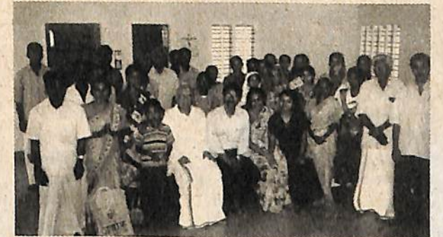
ട്രസ്റ്റിൽ നിന്ന് സഹായം ലഭിച്ചവരിൽ ചിലരും ട്രസ്റ്റ് പ്രവർത്തകരിൽ ചിലരും ജസ്റ്റിസ് കെ.റ്റി. തോമസിനോടൊപ്പം.